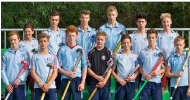
Die männliche U16 des UHC