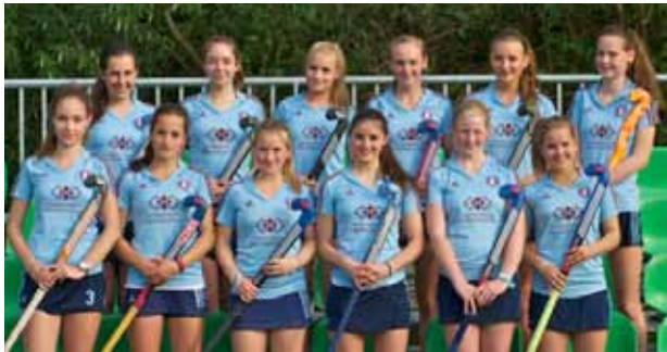
Die weibliche U16 des UHC